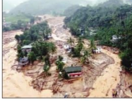
ਨਵੀਂ ਦਿੱਲੀ : ਕੇਰਲਾ ਦੇ ਪਹਾੜੀ ਖੇਤਰ ਵਾਇਨਾਡ 'ਚ ਭਾਰੀ ਮੀਂਹ ਕਾਰਨ ਸੋਲਵਾਰ ਦੌਰਾ ਭਾਰ ਜ਼ਮੀਨ ਸਿਕਰ ਨਾਲ 119 ਲੋਕਾਂ ਦੀ ਮੌਤ ਹੋ ਗਈ ਤੇ 400 ਤੋਂ ਵੱਧ ਲਾਪਤ ਹੋ ਗਏ।

ਨਵੀਂ ਦਿੱਲੀ : ਕੇਰਲਾ ਦੇ ਪਹਾੜੀ ਖੇਤਰ ਵਾਇਨਾਡ 'ਚ ਭਾਰੀ ਮੀਂਹ ਕਾਰਨ ਸੋਲਵਾਰ ਦੌਰਾ ਭਾਰ ਜ਼ਮੀਨ ਸਿਕਰ ਨਾਲ 119 ਲੋਕਾਂ ਦੀ ਮੌਤ ਹੋ ਗਈ ਤੇ 400 ਤੋਂ ਵੱਧ ਲਾਪਤ ਹੋ ਗਏ। ਬਚਾਅ ਕਾਰਜਾਂ ਵਿਚ ਖ਼ਲ ਤੇ ਹਵਾਈ ਸੈਨਾ ਵੀ ਲਾਗੂ ਕੀਤੀ ਹੈ। ਇਕੇ ਦੌਰਾਨ ਮਿਲਾਕਲ ਦੇ ਡੁੱਬ ਜਿਲ੍ਹੇ 'ਚ ਬੱਦਲ ਵਣਕ ਵਾਲਾ ਮਹੀਕਲ ਪਾਣੀ ਦੇ ਤੌਰ ਨਾਲ 'ਚ ਅਠਾਰਹ ਤੜ੍ਹ ਆ ਗਿਆ, ਜਿਸ ਕਾਰਨ ਇੱਕ ਪੁਰ ਤੇ ਸਥਾਪ ਦੇ ਠੱਕ ਸ਼ੀਰ ਤਿਨ ਤੁਕਾਨਾ ਡੁੱਬ ਗਈ।